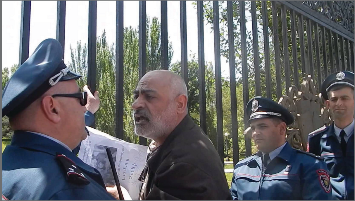
VARDGES GASPARI Human rights defender